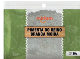
Pimenta do Reino Branca Moída 30g - 0403 - 7896485401882 1Kg - 0420 - 7896485421637 NCM: 09041200