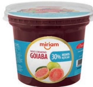
Goiaba 400g - 1173 - 1161 - 7896485421149 NCM: 20079990