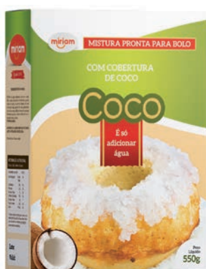
Coco com Cobertura de Coco 550g - 1294 - 1313 - 7896485421446 NCM: 19012000