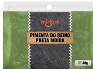
Pimenta do Reino Preta Moída 30g - 0405 - 7896485401868 1Kg - 0422 NCM: 09041200