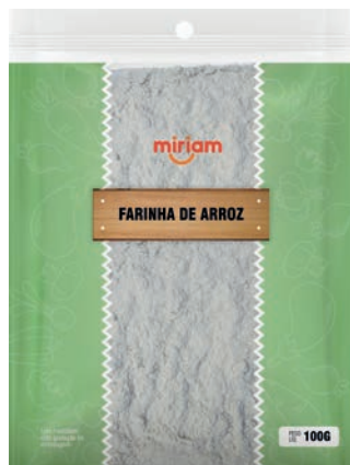
Farinha de Arroz 100g Cód 1256 - 1240 Cód Barras: 7896485421378 NCM: 11029000