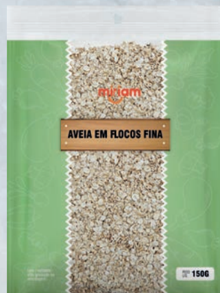
Aveia em Flocos Fina 150g Cód 0423 - 0424 Cód Barras: 7896485410440 NCM: 11041200