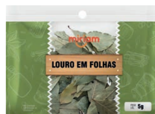
Louro em Folhas 5g Cód 1107 Cód Barras: 7896485409987 NCM: 09109900