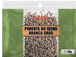
Pimenta do Reino Branca Grão 25g - 1114 - 7896485401875 1Kg - 0419 - 7896485421620 NCM: 09041100