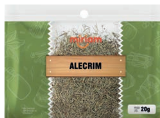
Alecrim 20g Cód 1095 Cód Barras: 7896485401004 NCM: 12119090