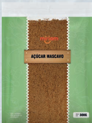
Açúcar Mascavo 300g Cód 1253 Cód Barras: 7896485421330 NCM: 17011300