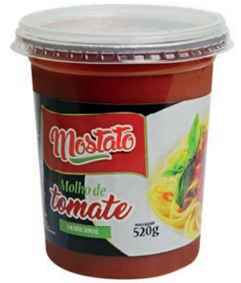
Molho de Tomate Tradicional 520g - 1178 - 7896485421170 NCM: 21032010