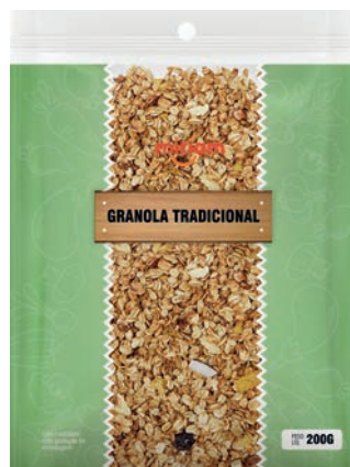
Granola Tradicional 200g Cód 0439 - 0440 Cód Barras: 7896485410594 NCM: 19041000