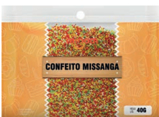
Confeito Missanga 40g - 1143 - 7896485400106 1Kg - 0411 - 7896485420654 NCM: 17049020