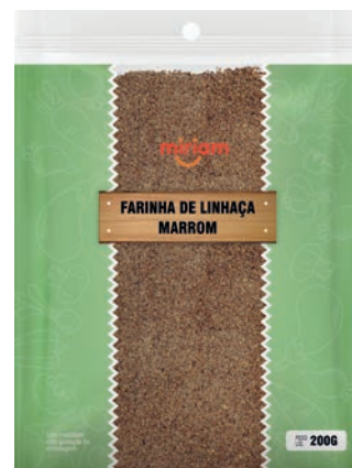
Farinha de Linhaça Marrom 200g Cód 1258 - 1242 Cód Barras: 7896485421361 NCM: 12040090