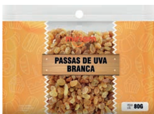
Passas de Uva Branca 80g Cód 0394 Cód Barras: 7896485400960 NCM: 08062000