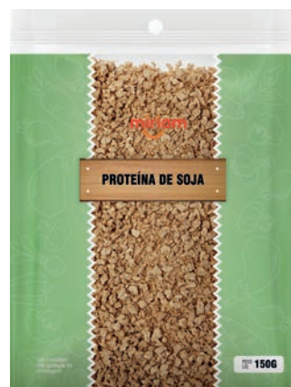
Proteína de Soja 150g Cód 1254 - 1238 Cód Barras: 7896485421347 NCM: 21061000