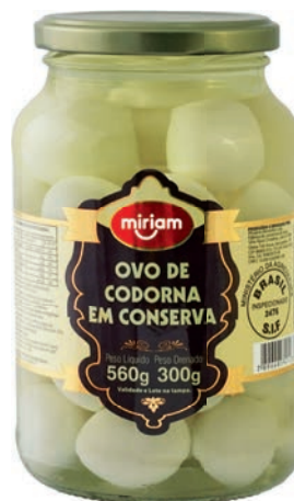
Ovo de Codorna 300g - 0558 - 7896485420388 NCM: 4089900