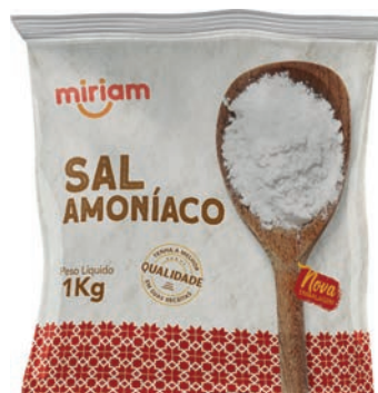
Sal Amoníaco 1Kg Cód 0566 Cód Barras: 7896485420791 NCM: 28369913