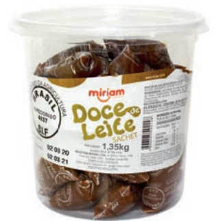
Doce de Leite Sachet 30g - 0459 - 0461 - 7896485402148 NCM: 19019020