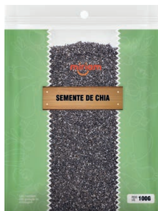
Semente de Chia 100g Cód 0593 Cód Barras: 7896485420739 NCM: 12079990