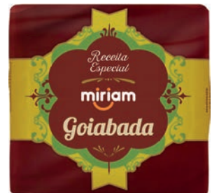
Goiabada 400g - 1375 - 0553 - 7896485405101 NCM: 20079990