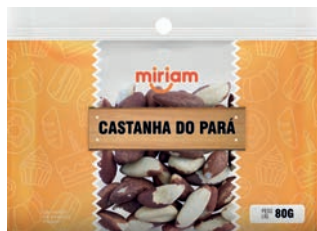
Castanha do Pará 80g Cód 0441 Cód Barras: 7896485410600 NCM: 08012200