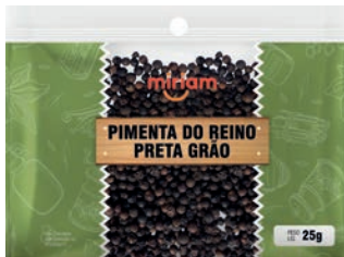
Pimenta do Reino Preta Grão 25g - 1116 - 7896485401851 1Kg - 0421 - 7896485401608 NCM: 09041100