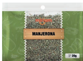
Manjerona 20g - 0744 - 7896485410105 1Kg - 0744 - 7896485421651 NCM: 121190 - 12119090