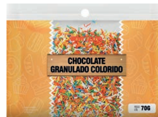
Chocolate Granulado Colorido 70g Cód 0380 - 0381 Cód Barras: 7896485400724 NCM: 17049090