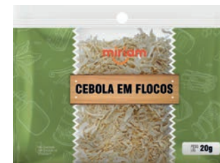
Cebola em Flocos 20g Cód 1099 Cód Barras: 7896485410303 NCM: 07122000