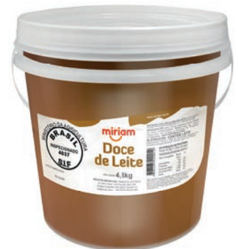
Doce de Leite 4,8Kg - 0457 - 7896485420012 NCM: 19019020