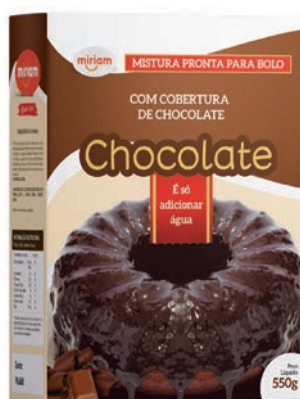
Chocolate com Cobertura de Chocolate 550g - 1293 - 1314 - 7896485421439 NCM: 19012000