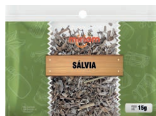
Sálvia 15g - 1120 - 7896485420500 1Kg - 0640 - 7896485421644 NCM: 091009900