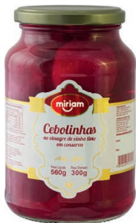
Cebolinhas em Conserva ao Vinho 300g - 0556 - 7896485412505 NCM: 20019000