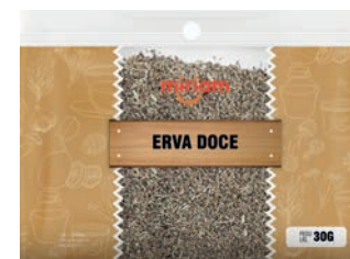
Erva Doce 30g - 0400 - 0328 - 7896485401837 1Kg - 0414 - 7896485401530 NCM: 09096110