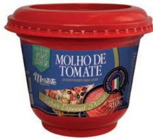
Molho de Tomate Sabor Pizza 310g - 1473 - 7896485422054 NCM: 21032010