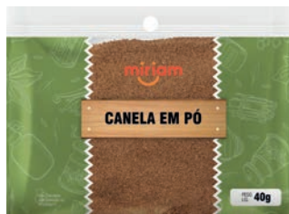
Canela em Pó 40g - 0397 - 0325 - 7896485401813 1Kg - 0408 - 7896485421422 NCM: 09062000