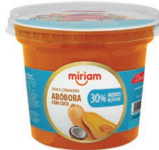
Abóbora com Coco 400g - 1171 - 1162 - 7896485421156 NCM: 20079990