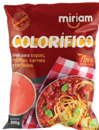
Colorau 200g - 0376 - 7896485420357 NCM: 21039029