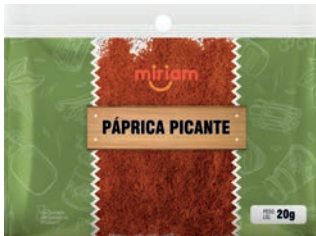
Páprica Picante 20g Cód 1425 Cód Barras: 7896485421842 NCM: 09042200