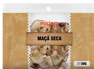
Maçã Seca 20g Cód 0383 Cód Barras: 7896485421408 NCM: 08133000