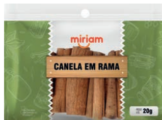
Canela em Rama 20g - 0326 - 0398 - 7896485401806 1Kg - 0409 - 7896485401462 NCM: 09061100 - 09061102