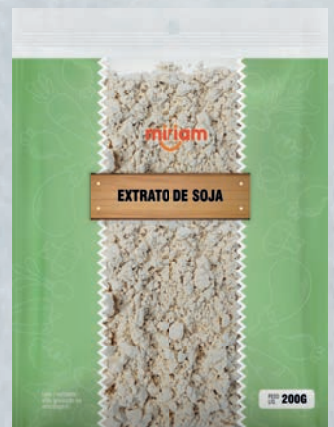
Extrato de Soja 200g Cód 0427 - 0428 Cód Barras: 7896485410471 NCM: 35040020