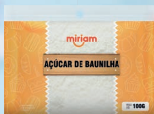
Açúcar de Baunilha 100g - 0638 - 7896485400762 500g - 0567 - 7896485420371 NCM: 17019100