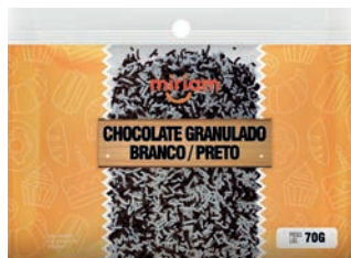
Chocolate Granulado Branco e Preto 70g Cód 0373 - 0374 Cód Barras: 7896485400809 NCM: 18069000