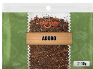
Adobo 15g Cód 1439 Cód Barras: 7896485421187 NCM: 21039029