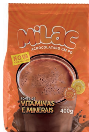
Achocolado em Pó 400g Cód 1472 - 1351 Cód Barras: 7896485421026 NCM: 18069000