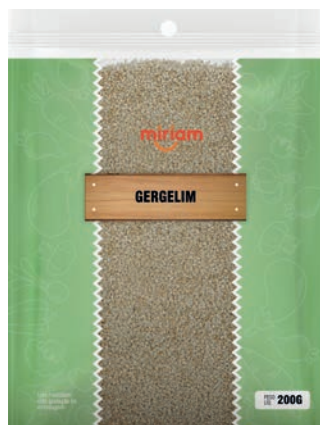
Gergelim 200g Cód 0431 - 0432 Cód Barras: 78964854210532 NCM: 12074090