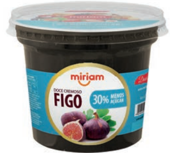
Figo 400g - 1172 - 1160 - 7896485421163 NCM: 20079990