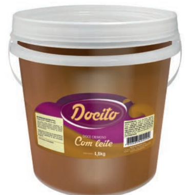
Doce Cremoso com Leite 4,8Kg - 0467 - 7896485420456 NCM: 19019020