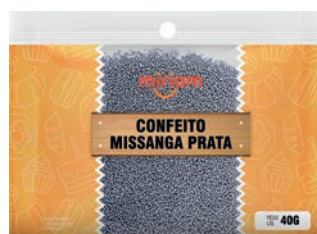
Confeito Prata 40g - 1144 - 7896485420746 1Kg - 0412 - 7896485421613 NCM: 17049020