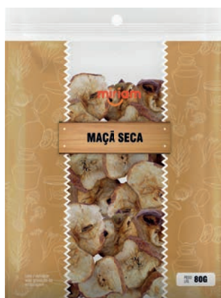
Maçã Seca 80g - 0383 - 0382 - 7896485400687 1Kg - 0415 - 7896485400076 NCM: 08133000