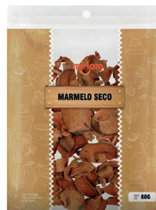
Marmelo Seco 80g - 0384 - 0385 - 7896485400694 1Kg - 0565 - 7896485420784 NCM: 08134090