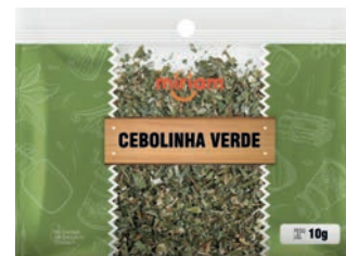
Cebolinha Verde 10g - 1100 - 7896485410143 1Kg - 1321 - 7896485421682 NCM: 07122000