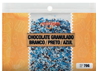
Chocolate Granulado Preto, Branco e Azul 70g Cód 0653 Cód Barras: 7896485421088 NCM: 18069000