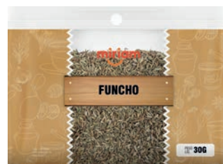
Funcho 30g Cód 1126 Cód Barras: 7896485410310 NCM: 09096190