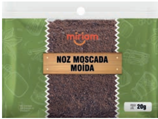
Noz Moscada Moída 20g - 1111 - 7896485409994 1Kg - 0417 - 7896485421699 NCM: 09081200