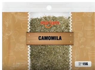
Camomila 15g Cód 0334 Cód Barras: 7896485401929 NCM: 09109900