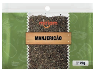
Manjeriço 20g Cód 1008 Cód Barras: 7896485410099 NCM: 1008