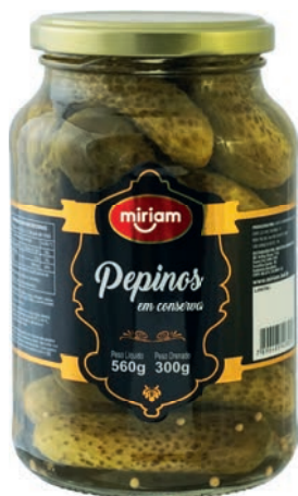
Pepinos em Conserva 300g - 0560 - 7896485408058 NCM: 20011000