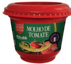
Molho de Tomate Especial + Manjericão 310g - 1444 - 7896485422009 NCM: 21032010