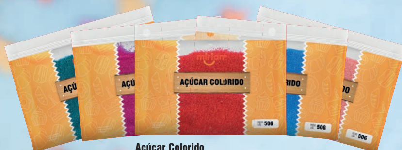
Açúcar Colorido 50g - 0335 - 7896485400014 1Kg - 0406 - 7896485421590 NCM: 17019100