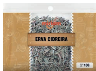
Erva Cidreira 10g Cód 1284 Cód Barras: 7896485421262 NCM: 12119090