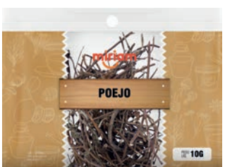
Poejo 10g Cód 1282 Cód Barras: 7896485421293 NCM: 12119090