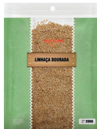
Linhaça Dourada 200g Cód 0433 - 0434 Cód Barras: 7896485410556 NCM: 12040090