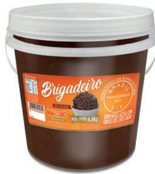
Brigadeiro Milac 4,8Kg - 1486 - 7896485422092 NCM: 19019090