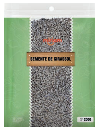
Semente de Girassol 200g Cód 1259 - 1243 Cód Barras: 7896485421392 NCM: 12079990