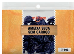
Ameixa Seca Sem Caroço 90g Cód 0322 Cód Barras: 7896485400946 NCM: 08132020