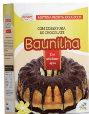
Baunilha com Cobertura de Chocolate 550g - 1296 - 1312 - 7896485421460 NCM: 19012000