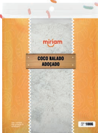
Coco Ralado Adoçado 100g Cód 1400 - 1401 Cód Barras: 7896485421835 NCM: 08011100