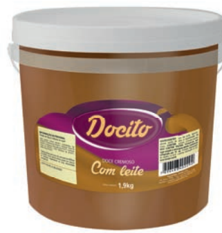
Doce Cremoso com Leite 1,9Kg - 0465 - 0466 - 7896485420487 NCM: 19019020