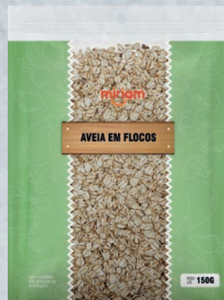
Aveia em Flocos 150g Cód 0425 - 0426 Cód Barras: 7896485410457 NCM: 11041200