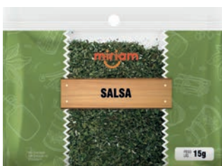
Salsa 15g - 1118 - 7896485409970 1Kg - 0639 - 7896485421583 NCM: 07129090