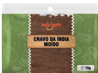
Cravo da Índia Moído 15g Cód 1105 Cód Barras: 7896485420326 NCM: 09072000