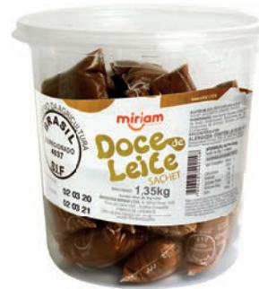
Doce de Leite Sachet 15g - 0460 - 0458 - 7896485402155 NCM: 19019020