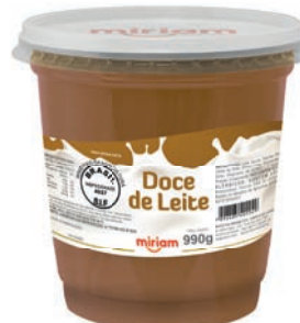
Doce de Leite 990g - 0453 - 0455 - 7896485402049 NCM: 19019020