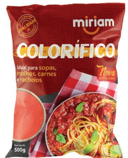
Colorau 500g - 0377 - 0378 Cód Barras: 7896485420340 NCM: 21039029