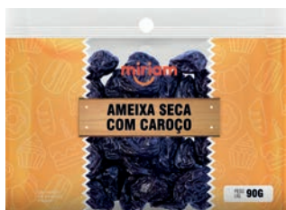
Ameixa Seca Com Caroço 90g Cód 0321 Cód Barras: 7896485400939 NCM: 08132010