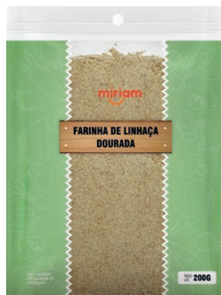
Farinha de Linhaça Dourada 200g Cód 0429 - 0430 Cód Barras: 7896485410495 NCM: 11041900 | 12089000