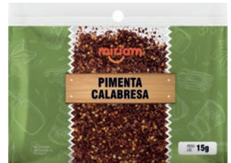
Pimenta Calabresa 15g Cód 1246 Cód Barras: 7896485421217 NCM: 09042200