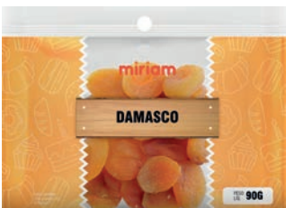
Damasco 90g Cód 0391 Cód Barras: 7896485410655 NCM: 08131000