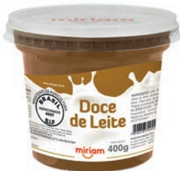
Doce de Leite 400g - 0452 - 7896485402209 NCM: 19019020