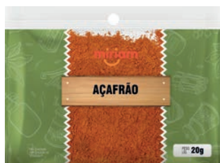
Açafrão 20g Cód 1094 Cód Barras: 7896485420883 NCM: 09103000