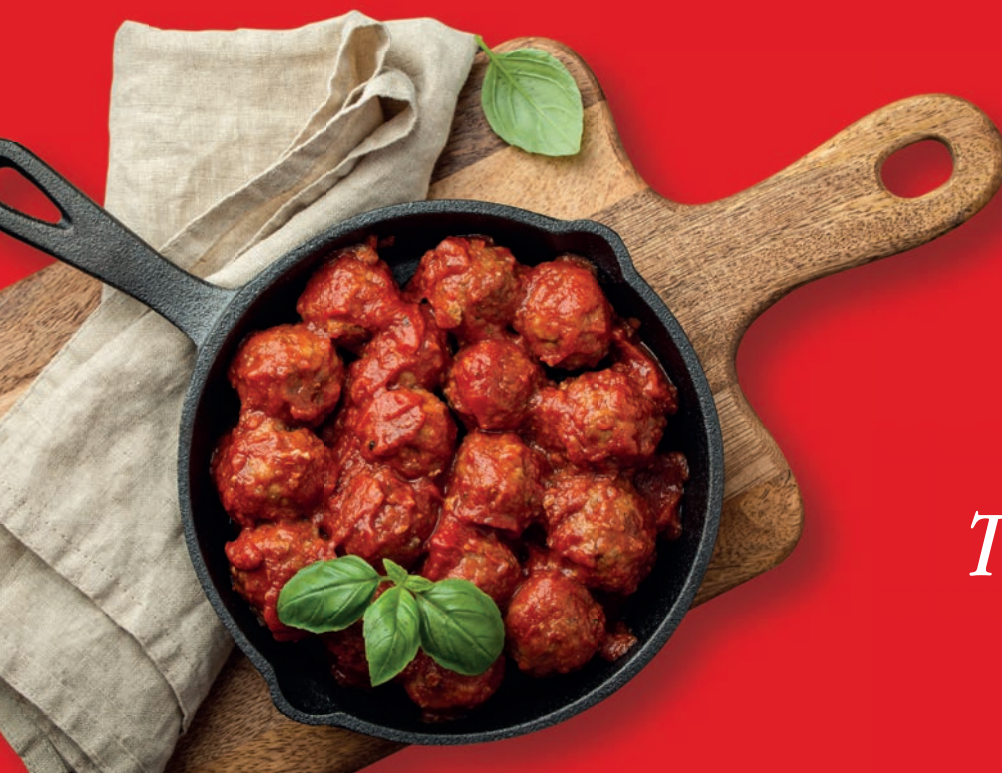
ESPECIAL + MANJERICÃO