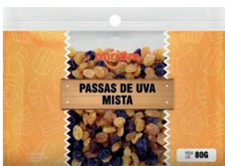
Passas de Uva Mista 80g Cód 0396 Cód Barras: 7896485400991 NCM: 08062000