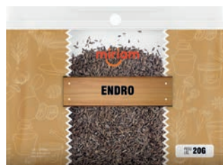
Endro 20g Cód 1124 Cód Barras: 7896485420302 NCM: 09109900