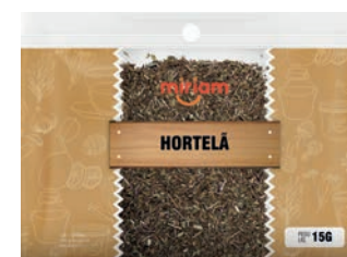
Hortelã 15g Cód 1129 Cód Barras: 7896485420296 NCM: 09022000