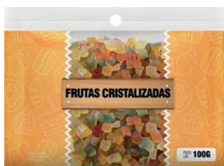
Frutas Cristalizadas 100g Cód 0392 Cód Barras: 7896485400977 NCM: 20060000