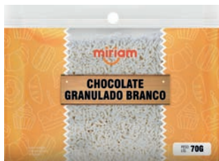
Chocolate Granulado Branco 70g Cód 0370 Cód Barras: 7896485400193 NCM: 17049020