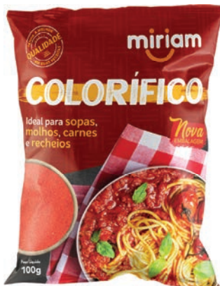
Colorau 100g - 1158 - 375 - 379 Cód Barras: 7896485420364 NCM: 21039029