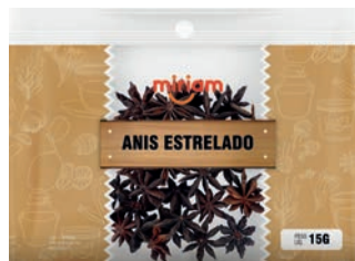
Anis Estrelado 15g Cód 0336 Cód Barras: 7896485409963 NCM: 09096120