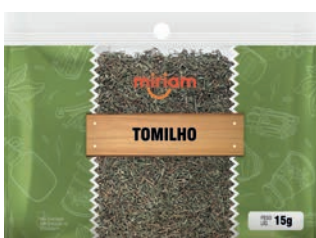
Tomilho 15g Cód 1121 Cód Barras: 7896485421125 NCM: 09109900