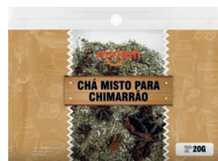
Chá Misto para Chimarrão 20g Cód 0324 Cód Barras: 7896485408126 NCM: 09030090