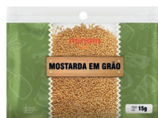
Mostarda em Grão 15g Cód 1245 Cód Barras: 7896485421200 NCM: 12075090