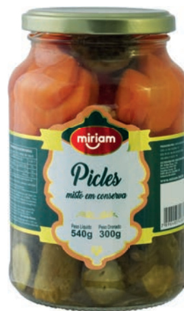
Picles em Conserva 300g - 0559 - 7896485408140 NCM: 20019000