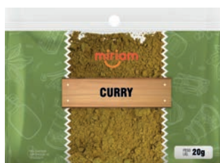
Curry 20g - 1244 - 7896485421194 1Kg - 1244 - 7896485400083 NCM: 21039029