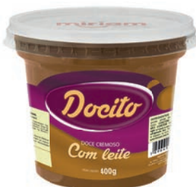
Doce Cremoso com Leite 300g - 0462 - 7896485402285 400g - 0463 - 7896485402292 NCM: 19019020