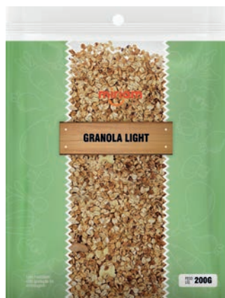
Granola Light 200g Cód 0437 - 0438 Cód Barras: 7896485410570 NCM: 11041900