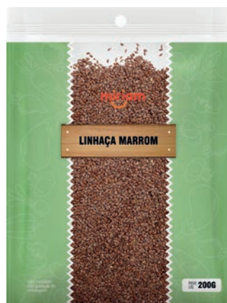
Linhaça Marrom 200g Cód 0435 - 0436 Cód Barras: 7896485410563 NCM: 12040090