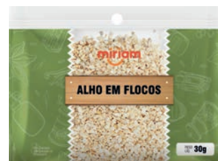
Alho em Flocos 30g - 1096 - 7896485410013 1Kg - 1320 - 7896485400007 NCM: 07129010 - 07129090