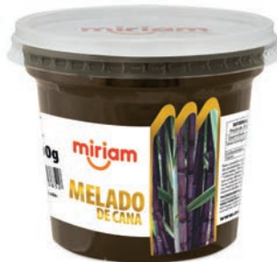
Melado 400g - 0765 - 7896485421415 950g - 1202 - 7896485420852 NCM: 17031000