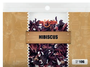
Hibiscus 10g Cód 0358 Cód Barras: 7896485420494 NCM: 12119090