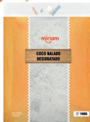
Coco Ralado Desidratado 100g Cód 1255 - 1239 Cód Barras: 7896485421354 NCM: 08011100