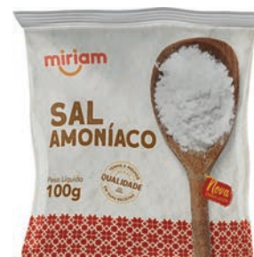
Sal Amoníaco 100g Cód 0388 - 0389 - 0630 Cód Barras: 7896485420333 NCM: 39269040 - 28369913