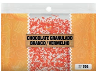
Chocolate Granulado Vermelho e Branco 70g Cód 0651 Cód Barras: 7896485421071 NCM: 17049090