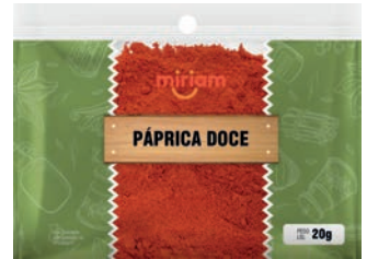
Páprica Doce 20g Cód 1113 Cód Barras: 7896485421118 NCM: 09042200