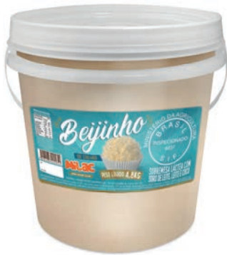
Beijinho Milac 4,8Kg - 1487 - 7896485422108 NCM: 19019090