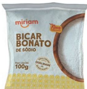
Bicarbonato de Sódio 100g Cód 0364 - 0365 - 0366 Cód Barras: 7896485400472 NCM: 28363000