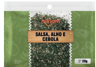
Salsa, Alho e Cebola 20g - 1119 - 7896485420517 1Kg - 1323 - 7896485421712 NCM: 9109900 - 07129090