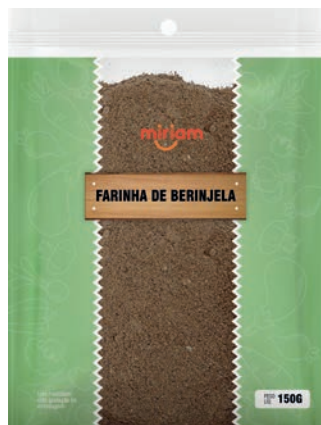
Farinha de Berinjela 150g Cód 1257 - 1241 Cód Barras: 7896485421385 NCM: 07129090