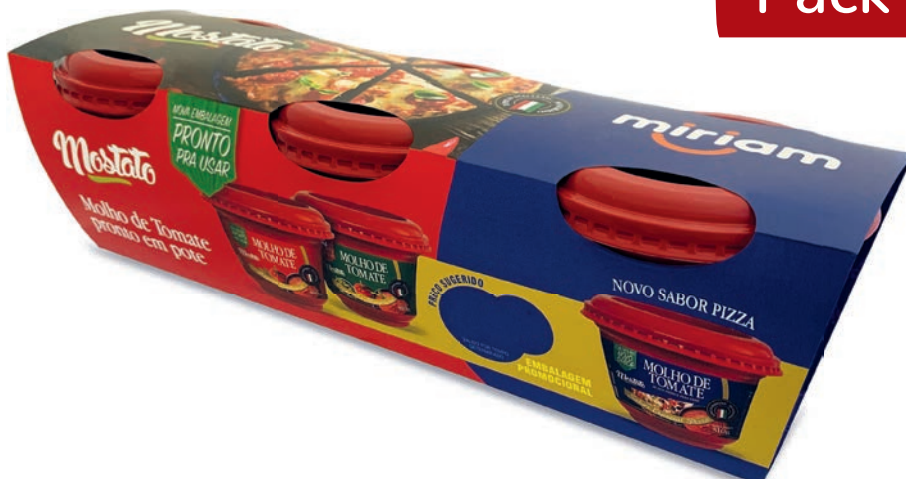
Kit Mostato 930g - 1445 Cód Barras: 7896485422016 NCM: 21039029