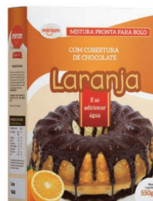
Laranja com Cobertura de Chocolate 550g - 1295 - 1315 - 7896485421453 NCM: 19012000