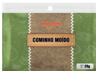
Cominho Moído 20g Cód 1103 Cód Barras: 7896485410266 NCM: 09093200