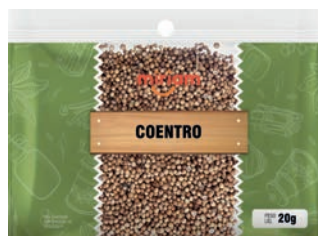
Coentro 20g Cód 1102 Cód Barras: 7896485420319 NCM: 09092100