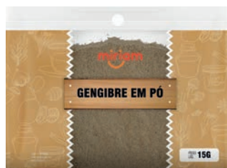
Gengibre em Pó 15g Cód 1127 Cód Barras: 7896485420876 NCM: 09101200