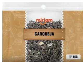
Carqueja 15g Cód 1249 Cód Barras: 7896485421279 NCM: 12119090