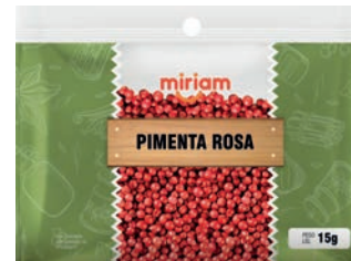
Pimenta Rosa 15g - 1489 - 7896485400113 NCM: 09041100