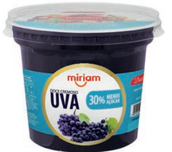
Uva 400g - 1174 - 1159 - 7896485421132 NCM: 20079990