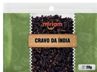
Cravo da Índia 20g - 0399 - 0327 - 7896485401820 1Kg - 0413 - 7896485401523 NCM: 09061100