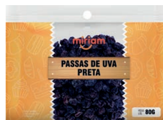
Passas de Uva Preta 80g Cód 0395 Cód Barras: 7896485400953 NCM: 08062000