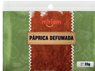
Páprica Defumada 20g Cód 1488 Cód Barras: 7896485422115 NCM: 09042200