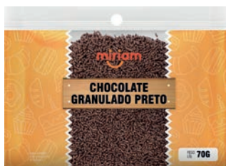
Chocolate Granulado Preto 70g - 0371 - 0372 - 7896485400618 1Kg - 0410 - 7896485421606 NCM: 18069000