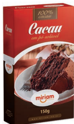
Cacau em Pó 150g Cód 0595 Cód Barras: 7896485420715 NCM: 18050000