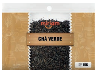
Chá Verde 15g Cód 1123 Cód Barras: 7896485421101 NCM: 09022000