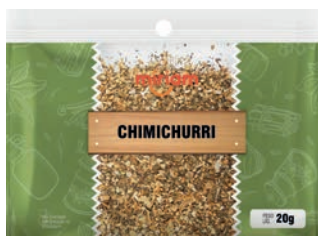
Chimichurri 20g - 1101 - 7896485420869 1Kg - 1322 - 7896485421675 NCM: 07129090