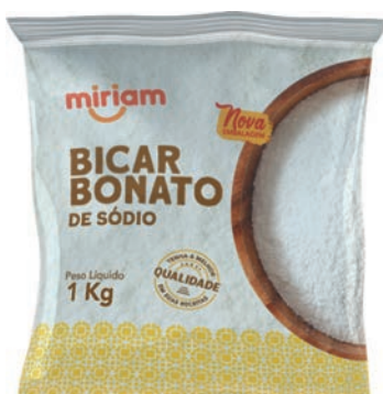
Bicarbonato de Sódio 1kg Cód 0407 Cód Barras: 7896485421569 NCM: 28363000