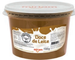
Doce de Leite 700g - 0454 - 7896485402223 NCM: 19019020