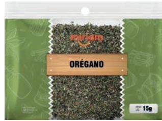
Orégano 15g - 0401 - 7896485410297 100g - 0387 - 7896485401678 1Kg - 0418 - 7896485421576 NCM: 12119010