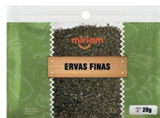
Ervas Finas 20g Cód 1106 Cód Barras: 7896485410075 NCM: 21039029