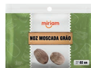
Noz Moscada Grão 02 unid. - 0333 - 7896485401127 1Kg - 0416 - 7896485421811 NCM: 09081000