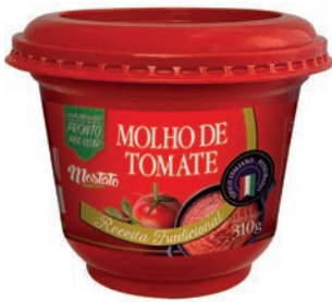
Molho de Tomate Tradicional 310g - 1443 - 7896485422030 NCM: 21032010