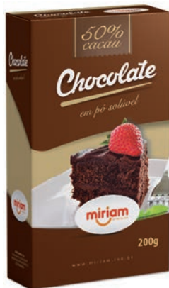
Chocolate em Pó 200g Cód 0594 Cód Barras: 7896485400854 NCM: 18069000